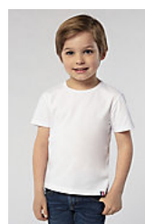
ATF LOU 03274