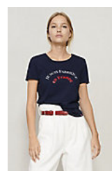
ATF LOLA 03273