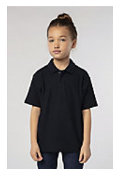
SOL'S SUMMER II KIDS 11344