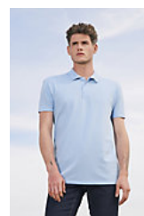
SOL'S SUMMER II 11342